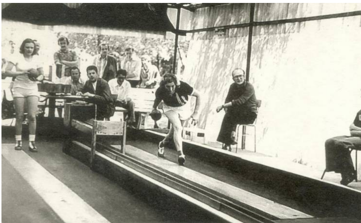
Jeden z pierwszych meczy ligowych na kręgielni „Pilicy” – ok. 1975 r.