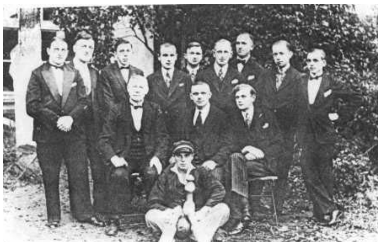
Klub Kreglarzy „Dziewiątka” we Wronkach w 1931 r.