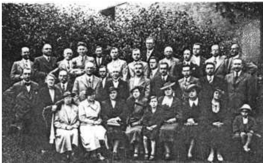
Mecz kręglarski Czarnków – Poznań w 1938 r.