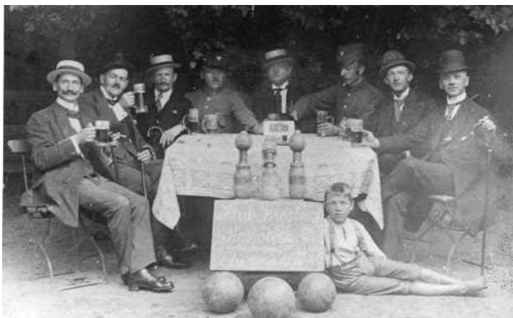
Klub Kęglarzy „Kawalerka Górą” w Zdunach – 18.07.1920 r.