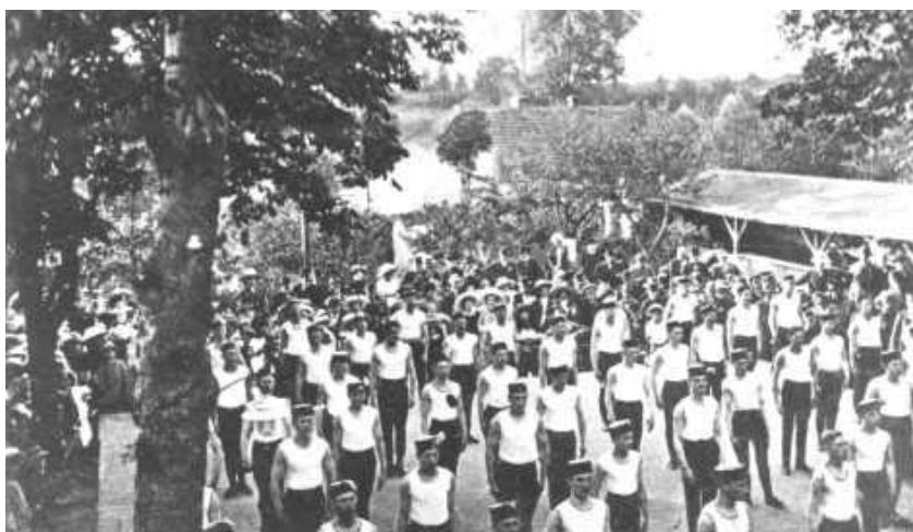
Ćwiczenia TG „Sokół” we Wronkach w 1913 r.. Z prawej zadaszona kręgielnia towarzystwa.