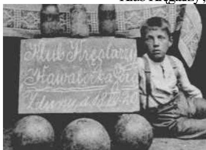
Tablica z nazwą klubu w Zdunach (fragment zdjęcia)

W Śremie istniały w latach międzywojennych trzy kęgielnie: przy restauracji „Bazar” wzdłuż ul. Łazienkowej, przy kawiarni Muchy i przy restauracji Sałacińskiego przy ul. Poznańskiej. Były też takie obiekty dużo wcześniej. Na istniejących obiektach grali bywalcy tych obiektów i członkowie bractwa kurkowego. Właśnie wśród nich powstała 1936 r. myśl wybudowania dwutorowego obiektu przy strzelnicy. Budowę rozpoczęto w pierwszych miesiącach 1937 r. i ukończono niemałym wysiłkiem już w pierwszej połowie następnego roku.