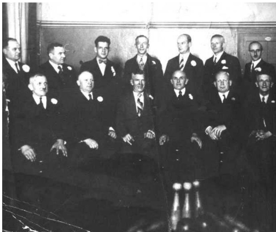
Obywatelski Klub Kęglarzy w Lesznie przed 1939 r.