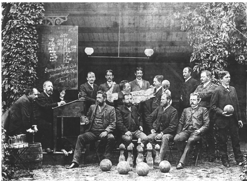
Klub Kręglarski „Sonnabend Kegelclub” w Lesznie z 17.09.1892 r.

Rawiczu, Wschowie i innych miasteczkach ziemi leszczyńskiej. Silna germanizacja w okresie zaborów doprowadziła do ziemienia bractw kurkowych, a w których – wobec braku innych – udzielali się również mieszkający tu Polacy. Na początku lat dziewięćdziesiątych XIX wieku zawiązał się klub, który od dnia treningów, przyjął nazwę „Sonnabend Kegelclub” (Sobotni Klub Kręglarski). Znajdujące się w muzeum zdjęcie tego klubu, datowane 17.09.1892 r., jest jednym z najstarszych zdjęć klubu kręglarskiego na terenach polskich. (drugie po Żyrdowie). Grę w kręgle włączało do swych zajęć również TG „Sokół” założone w 1902 r., ale ze względu na rozwiązanie się po trzech latach większych rezultatów nie uzyskało.