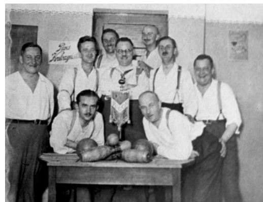
Kręglarze KK „Pogoń” w Poznaniu ok. 1930 r. podczas treningu – na lewo na kręgielni, na prawo - po treningu humor jak zawsze kręglarzom dopisywał